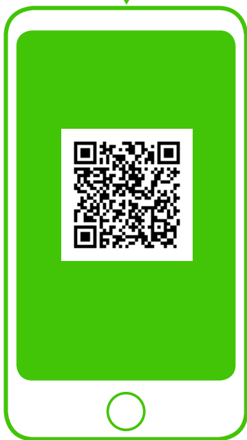
※新型コロナ対策パーソナルサポート (行政) QRコードから登録